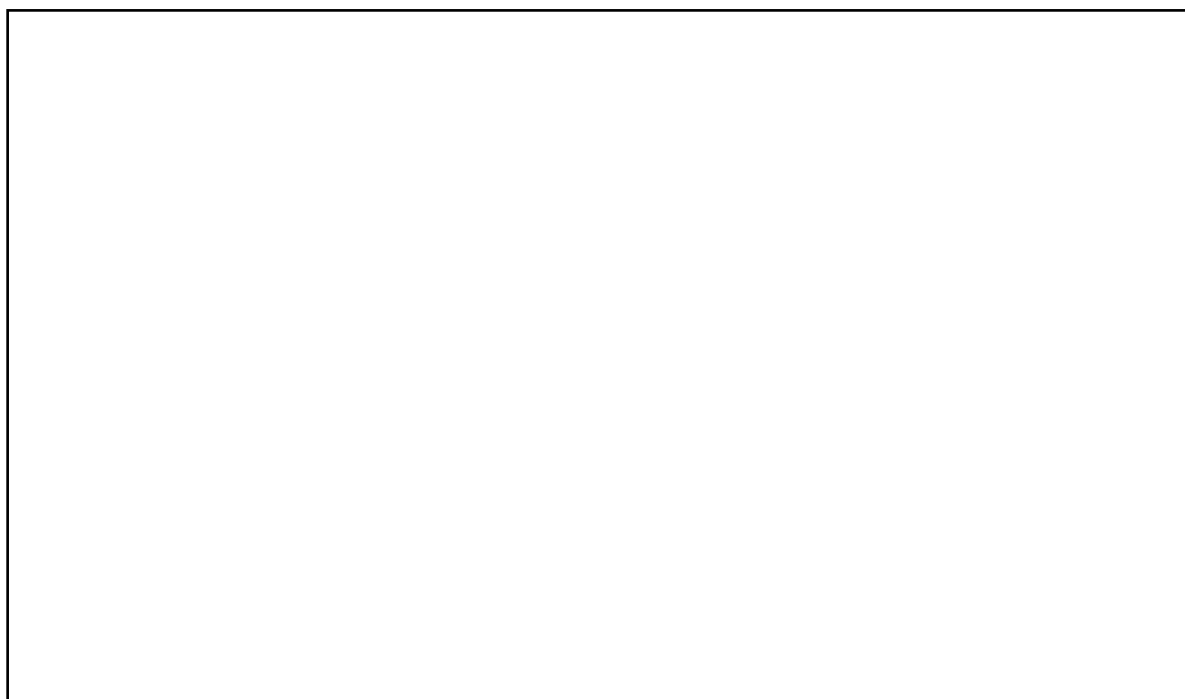
插图 2-1-2 矿区水系分布图

梅溪河：位于矿山西北部，流向北东，至矿山北部下游约 5km 处汇入石期河。梅溪河常年流水，河宽 10~30m，平均深度约 2.5m。正常流量 7~15m 3 /s，最大流量可达 120m 3 /s，区内水位标高 131m~144m。属于区内较重要的水源地，是当地灌溉用水的主要来源。